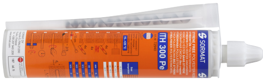
ITH 300 Pe